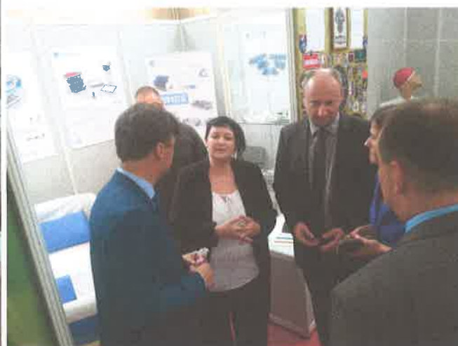
Zagorski gospodarski zbor