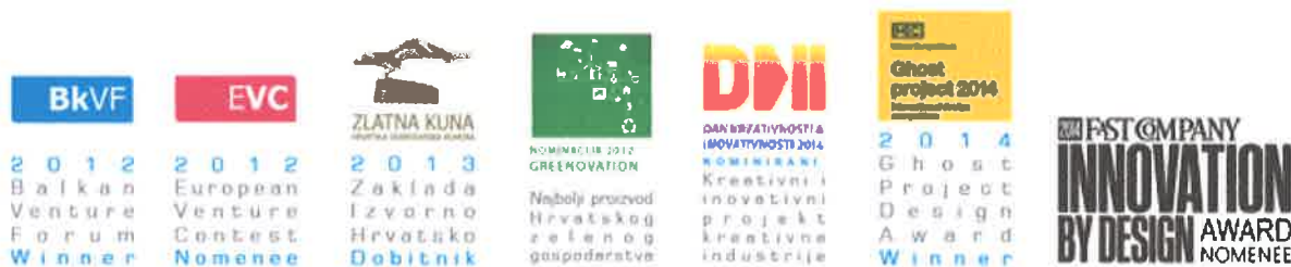
Slika 1 Nagrade i priznanja

Prošle godine proizvod tvrtke EVOLVE, "Medicinsko pomagalo za njegu teže pokretnih i nepokretnih osoba", dobitnik je nagrade iz zaklade „Izvorno Hrvatsko“ HGK, Zlatna kuna . Isto tako, tvrtka je dobitnik različitih priznanja poput diplome grada Donja Stubica za inovativno poduzetništvo . Sa projektom "Enfojer" tvrtka je pobjednik dizajnerskog natječaja Mixer//Ghost festivala u Beogradu , a također je i nominirana za nagradu DKI - prestižna nagrada hrvatskog dizajna u sklopu Dana kreativnosti i inovativnosti Zagreb, te smo ostvarili nominaciju za međunarodnu nagradu "Innovation by design", SAD . U 2014. g. izlagali smo na "Tjednu dizajna" u Zagrebu, također izlagali smo u Centru za dizajn ZZID-a HGK, Zagreb, te sudjelovali na "Danu D" - dizajnerskoj izložbi u Zagrebu.