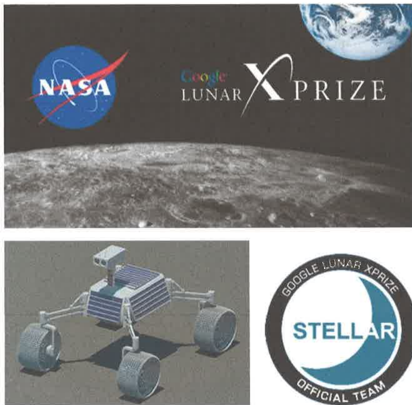
Slika 2 Tvrtnica EVOLVE članica je STELLAR AEROSPACE KLASTERA i "Team Stellar" tima na GLPX međunarodnom natjecanju

Rad tvrtke promoviran je u raznim novinama i na portalima, te televiziji (više u Prilogu):