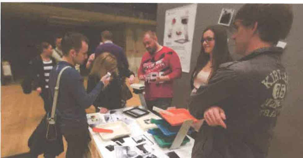
Evolve na Tjednu dizajna

Učimo ih o materijalima, bojama, zašto smo primijenili neka tehnička rješenja, jer je startupima bitno da zna što više o svom proizvodu i te da može o njemu kompetentno pričati. Velik dio razvoja predstavljaće svoje proizvode nekom VC-u i pritom moraju biti upoznati s time što je, kako se to napravi, zašto baš tako napravljeno, znati zašto je cijena proizvodnje takva kakva jest i druge detalje vezane uz proizvodnju i razvoj.